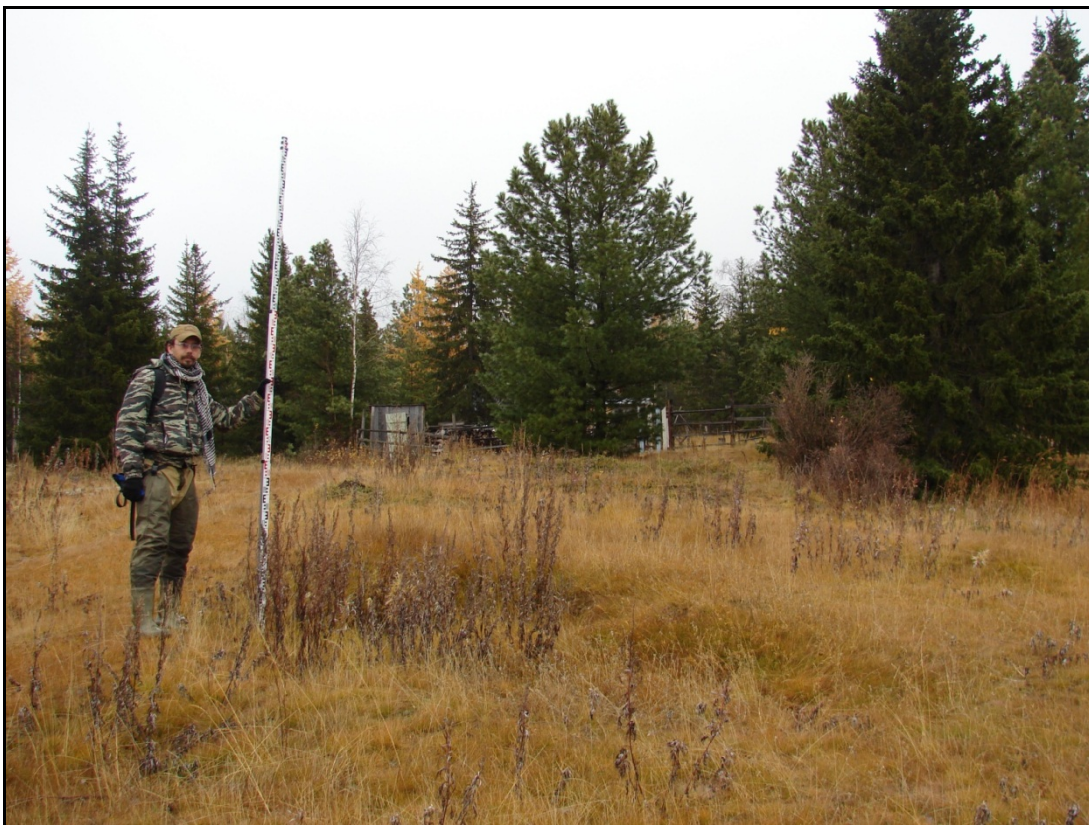
Фото 4. Вид на остатки сооружения №3 выявленного объекта археологического наследия «Поселение Харьерлор 1». Снято с севера.