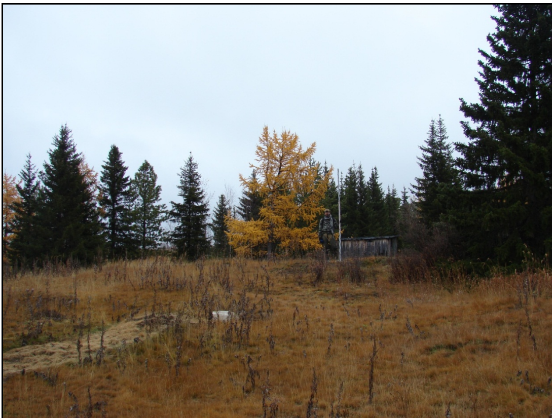
Фото 3. Вид на остатки сооружения №2 выявленного объекта археологического наследия «Поселение Харьерлор 1». Снято с запада.