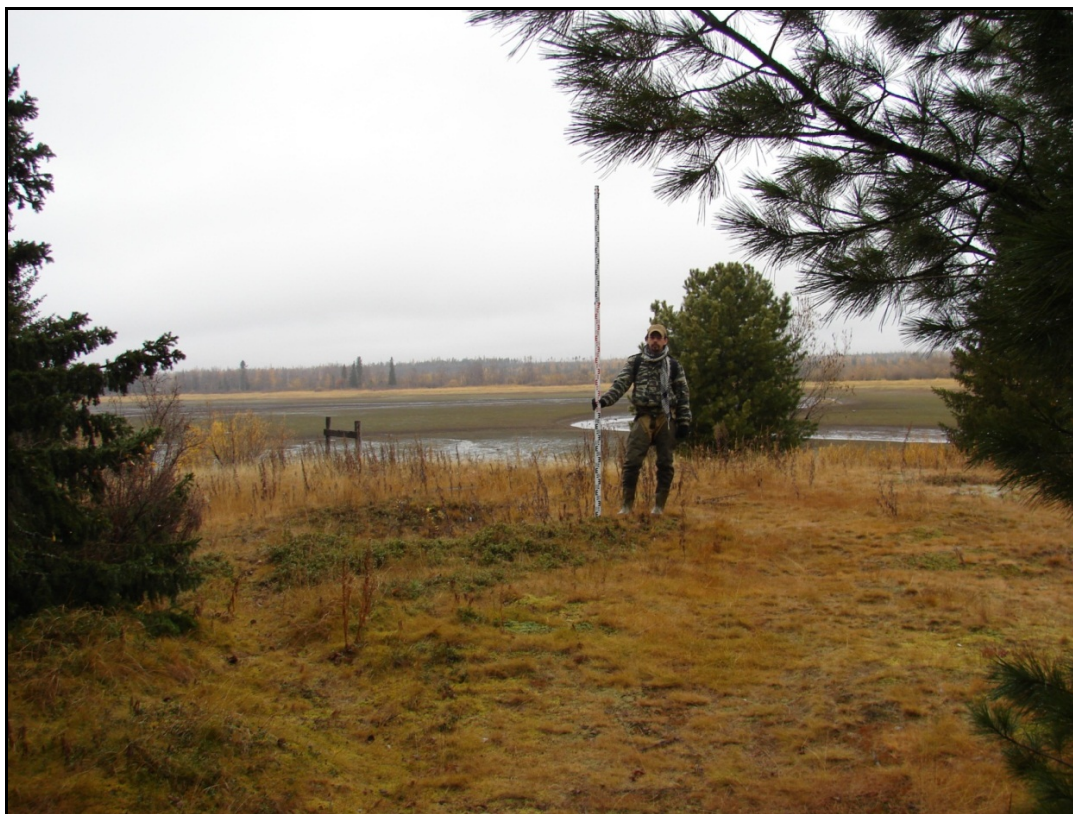
Фото 2. Вид на остатки сооружения №2 выявленного объекта археологического наследия «Поселение Харьерлор 1». Снято с юга.