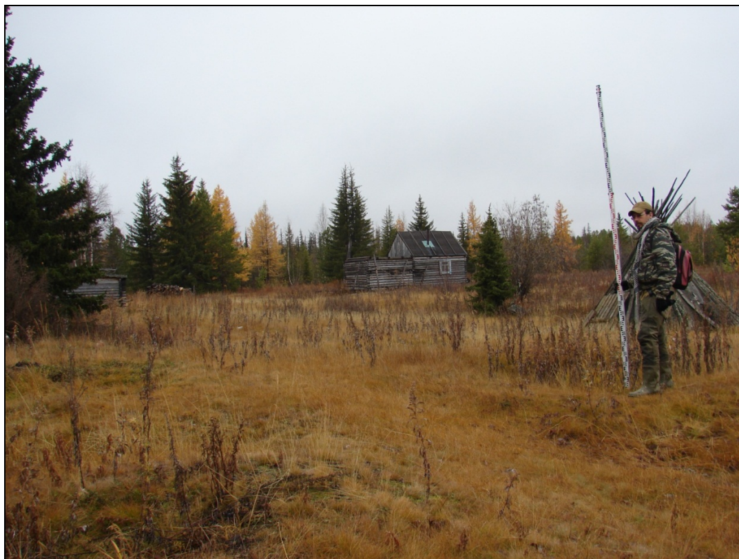
Фото 1. Общий вид выявленного объекта археологического наследия «Поселение Харьерлор 1». Дом на территории сезонного поселка хантов. Снято с запада.