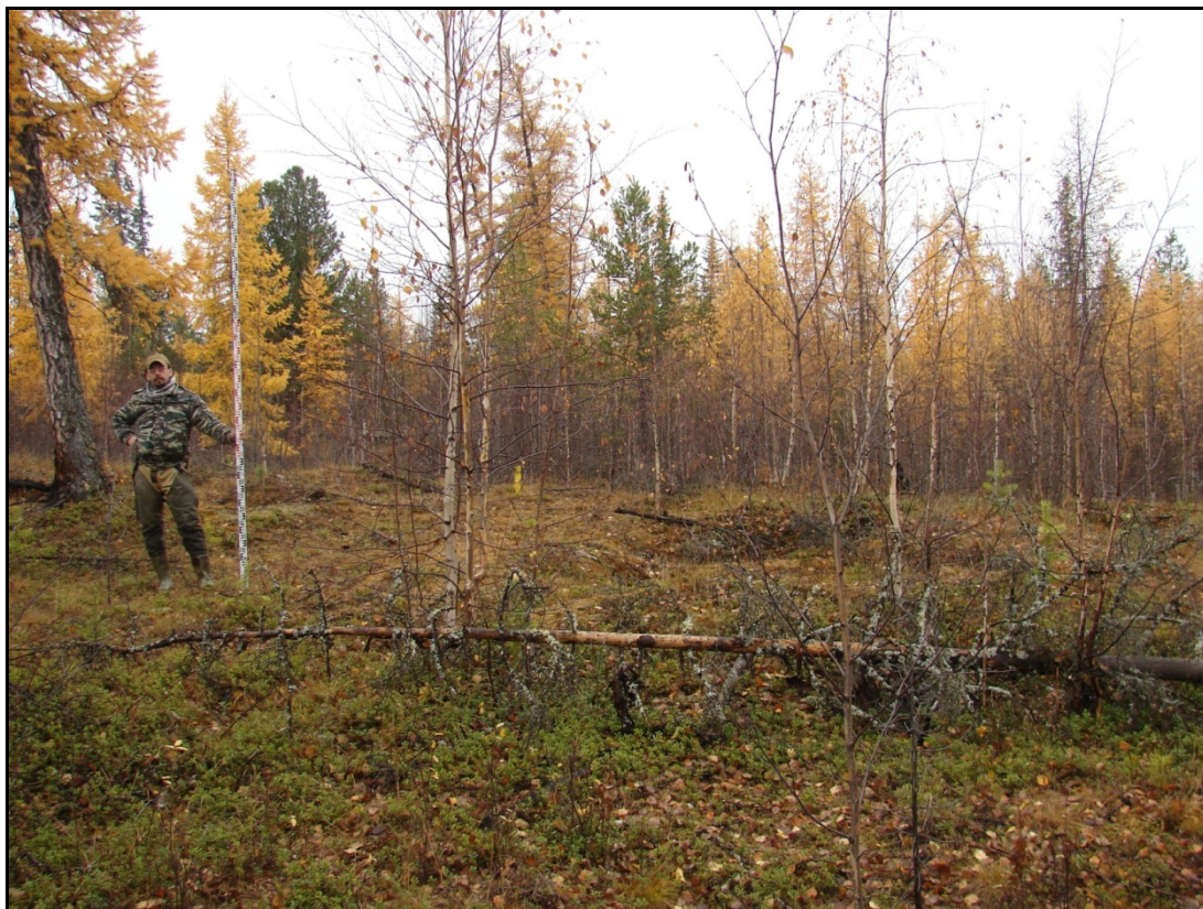
Фото 3. Общий вид выявленного объекта археологического наследия «Могильник Харьерлор 2». Снято с запада.