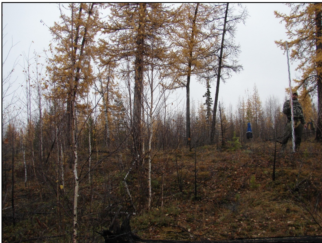
Фото 1. Общий вид выявленного объекта археологического наследия «Могильник Харьерлор 2». Снято с севера.