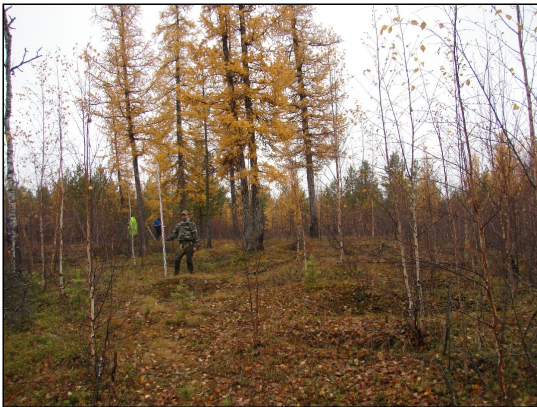
Фото 2. Могильные ямы грунтового типа выявленного объекта археологического наследия «Могильник Харьерлор 2». Снято с юга.