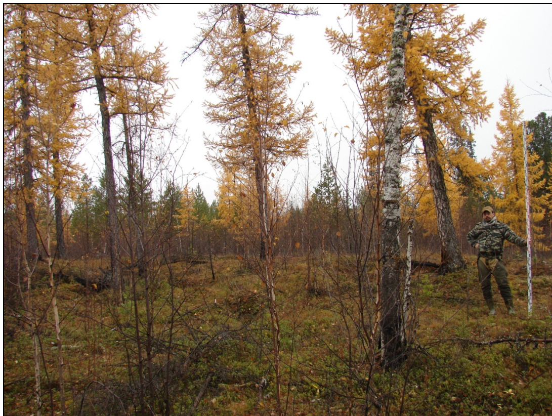
Фото 4. Общий вид выявленного объекта археологического наследия «Могильник Харьерлор 2». Снято с запада.