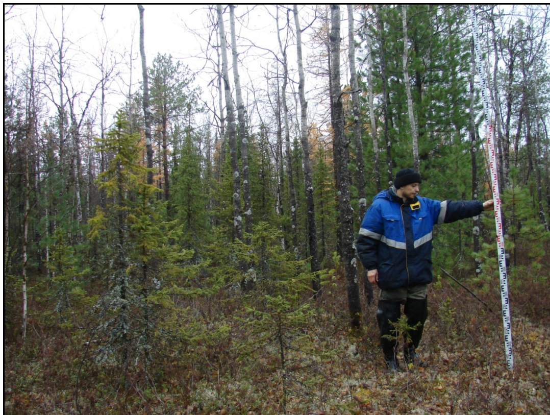
Фото 2. Общий вид выявленного объекта археологического наследия «Поселение Лесмиеган 1». Снято с запада.