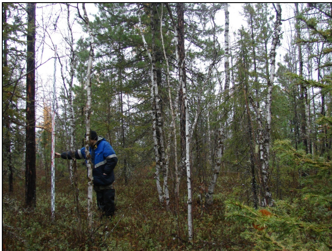
Фото 1. Общий вид выявленного объекта археологического наследия «Поселение Лесмиеган 1». Снято с востока.