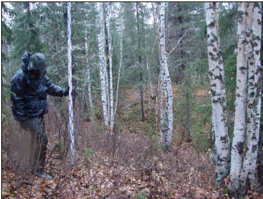
Фото 4. Фортификационные сооружения выявленного объекта археологического наследия «Городище Несъеган 1». Снято с запада.