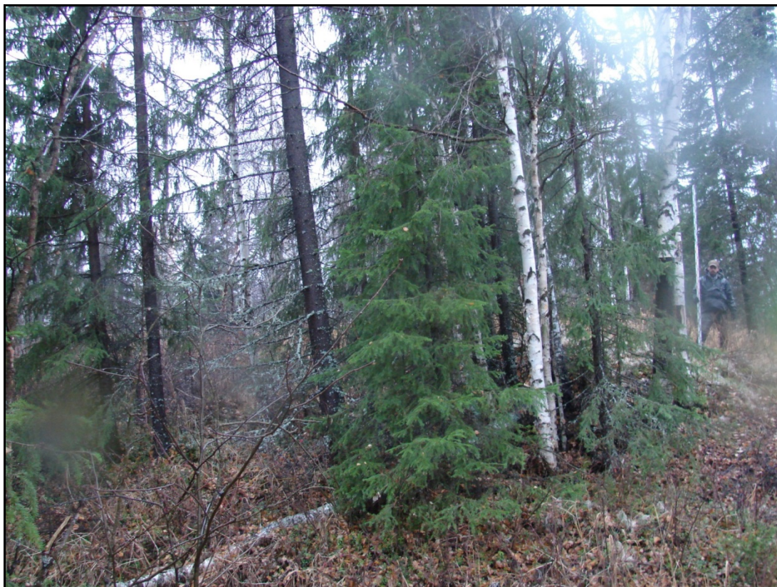
Фото 3. Общий вид выявленного объекта археологического наследия «Городище Несъеган 1». Снято с северо-востока.