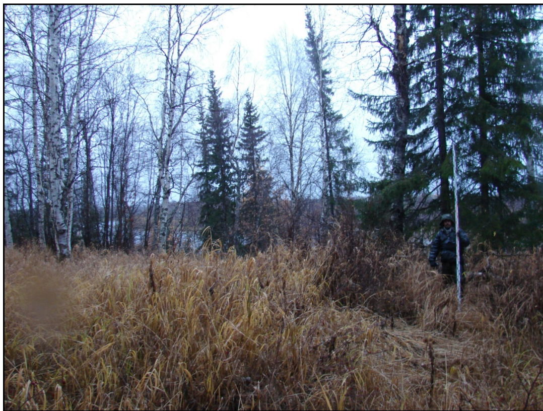
Фото 2. Площадка I выявленного объекта археологического наследия «Городище Несъеган 1». Снято с востока.