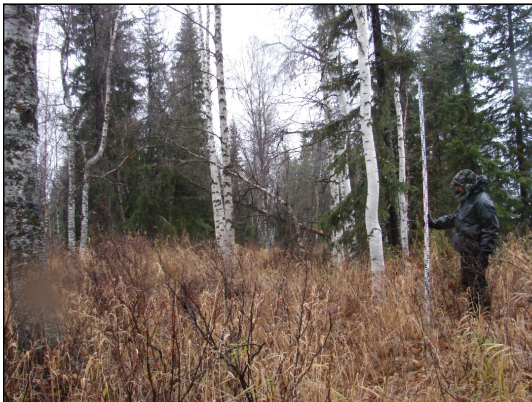
Фото 1. Площадка I выявленного объекта археологического наследия «Городище Несъеган 1». Снято с запада.