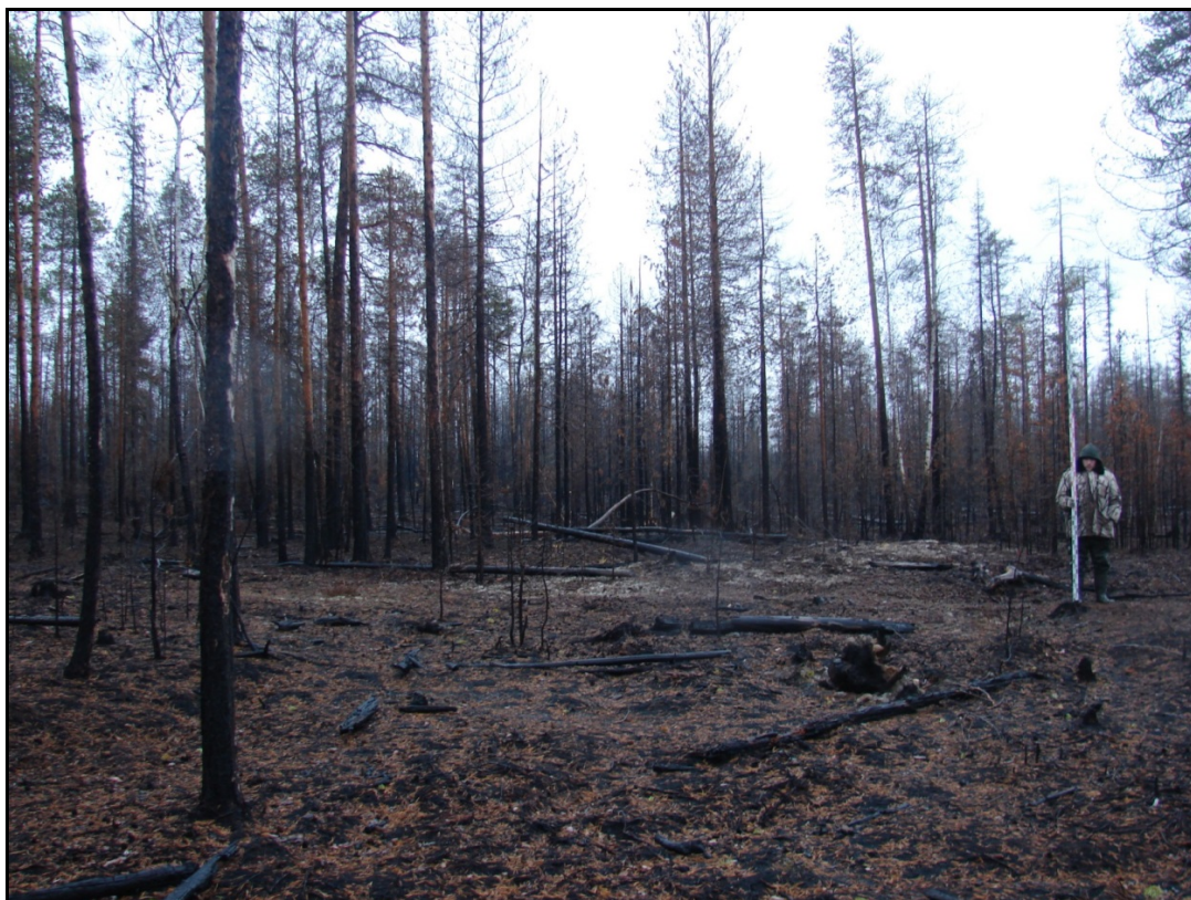
Фото 1. Общий вид выявленного объекта археологического наследия «Поселение Несъеган 3». Снято с севера.