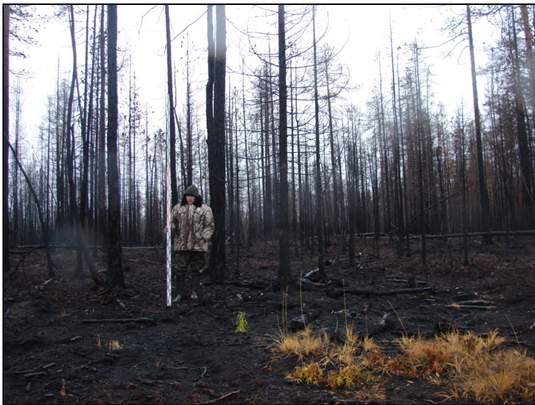
Фото 2. Общий вид выявленного объекта археологического наследия «Поселение Несъеган 3». Снято с юга.