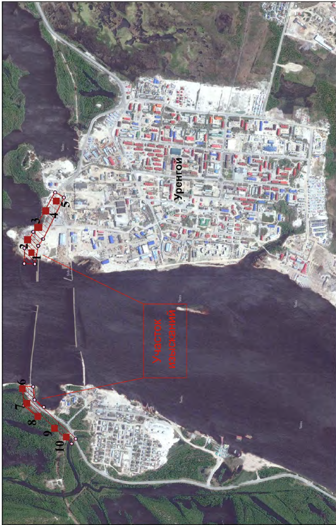
Рис. 2. «Строительство мостового перехода через реку Пур на автомобильной дороге Коротчаево - Уренгой». Карта расположения объекта М : 15 000.