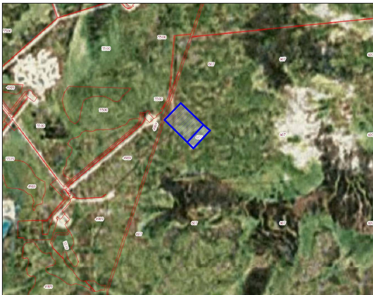
Прил. 3. Схема расположения проектируемого объекта (обозначен синим цветом)