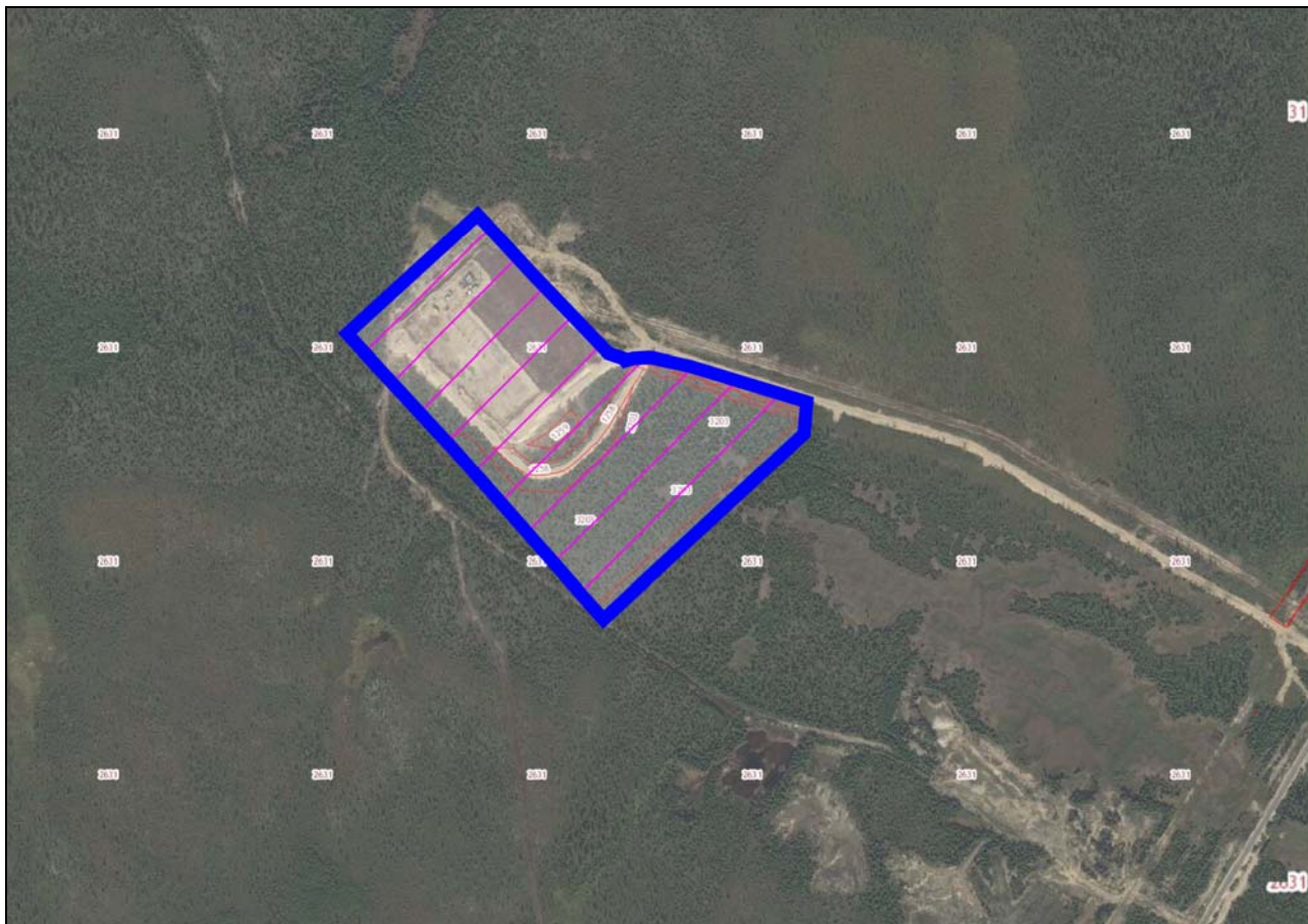
Прил. 3. Схема расположения проектируемого объекта (обозначен синим цветом)