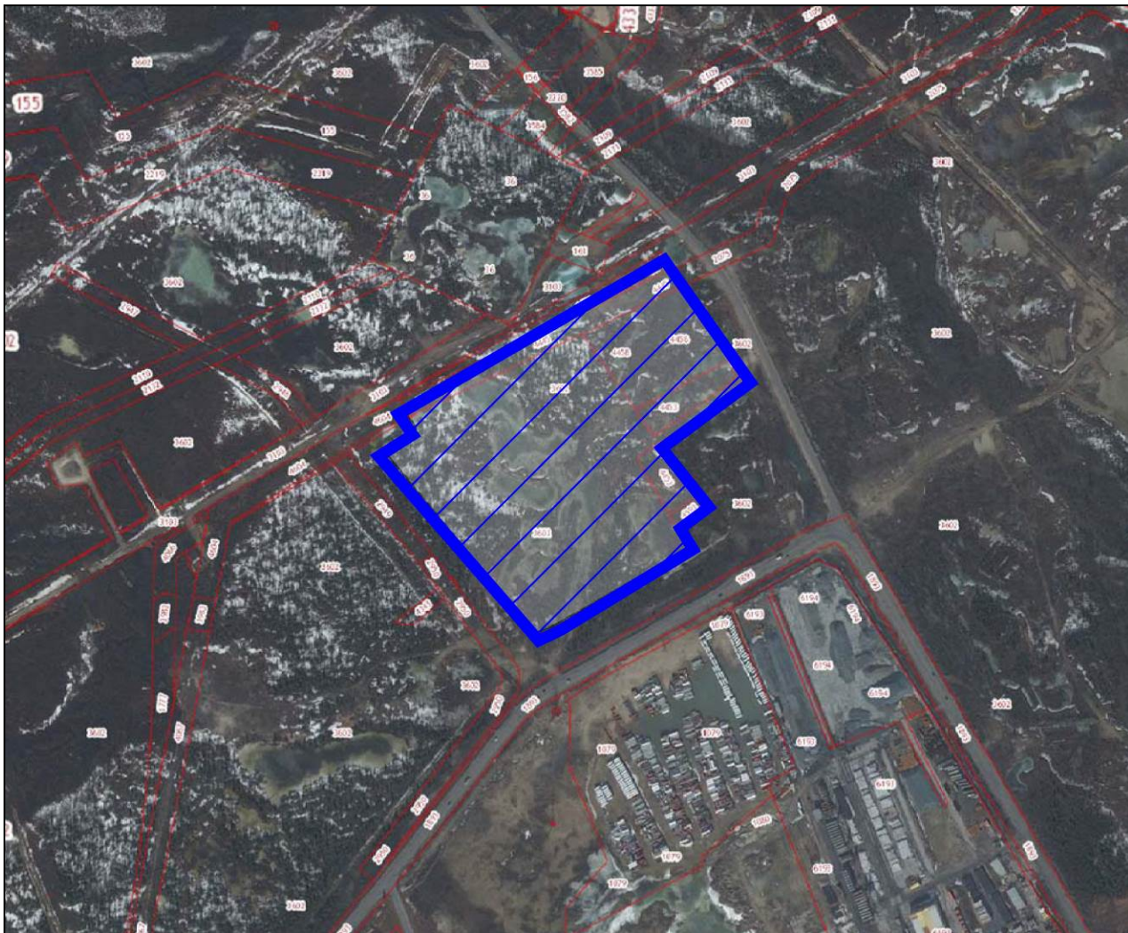
Прил. 3. Схема расположения проектируемого объекта (обозначен синим цветом)