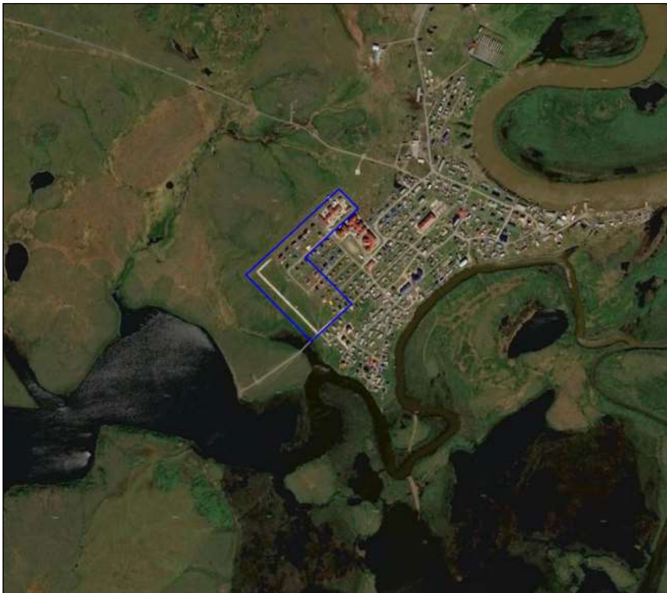
Прил. 3. Схема расположения испрашиваемого участка (выделен синим цветом).