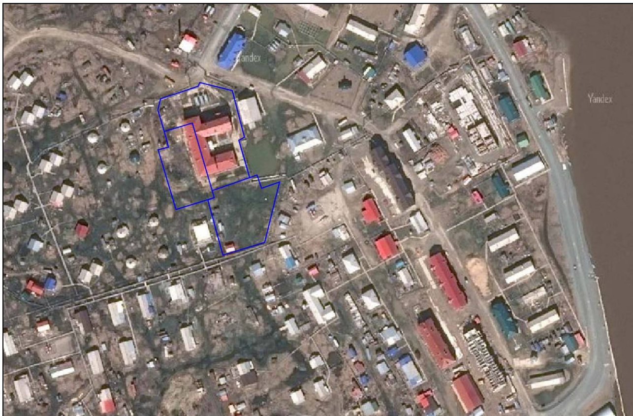
Прил. 5. Схема расположения испрашиваемого участка (обозначен синим цветом)